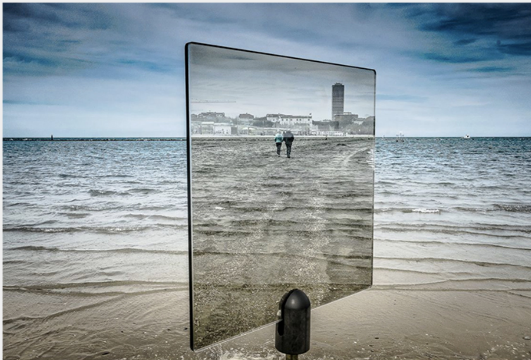
— Impro 2, dietro lo sguardo